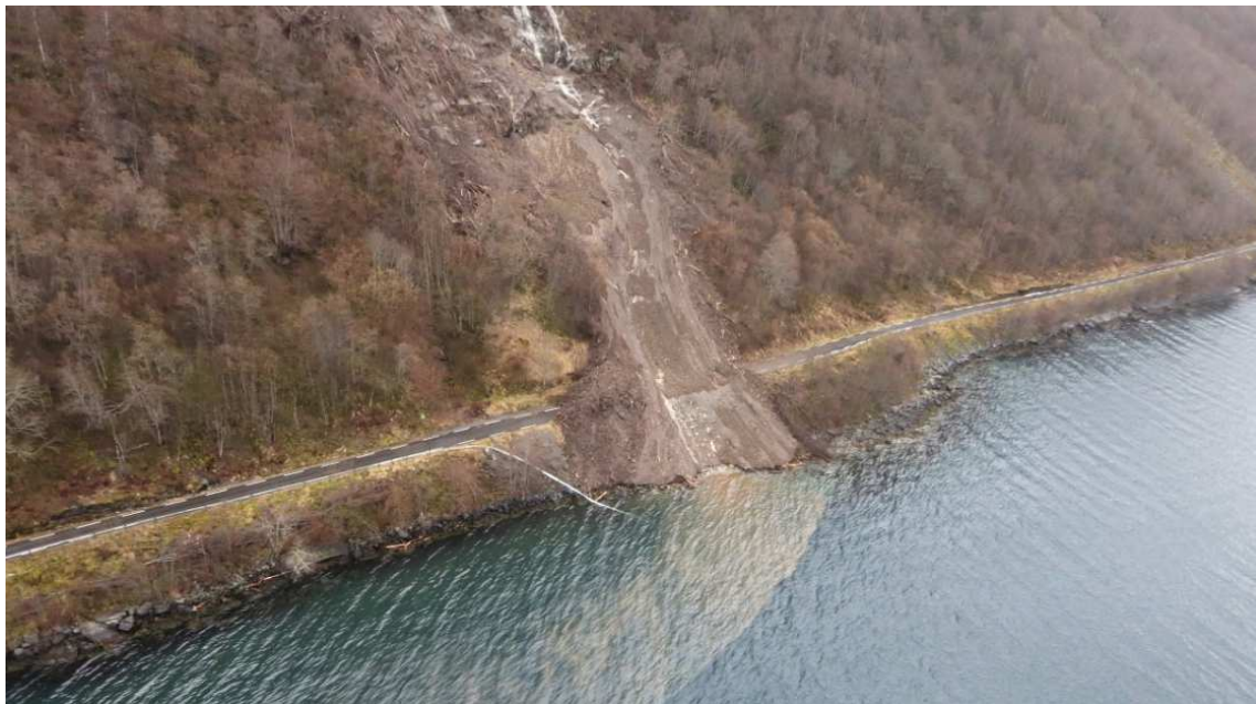
Ras på Eitrestrondi i 2014

Dei som bur i og vitjar området/kommunen bør få informasjon om at naturreservatet eksisterer, kva verneverdiane er og kva alternative måtar for å «oppleve området» som finst. Informasjon bør vere tilgjengeleg både før folk reiser til kommunen og under opphaldet. Merkevarerstrategien for nasjonalparkar og andre verneområde skal takast i bruk. Det er eit også mål å kunne introdusere ein ny brukargruppe til naturreservatet: forskarar. Det er eit mål å auke aksept og forståing for naturreservatet blant grunneigarane.